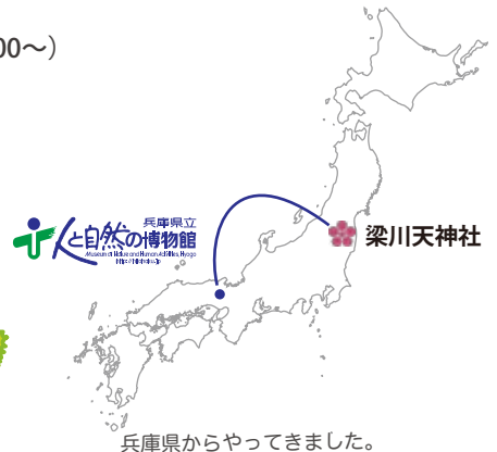
兵庫県からやってきました。