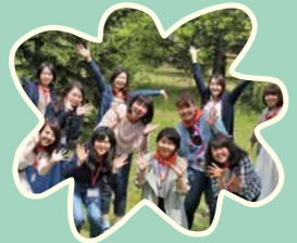
コーススタッフの おねえさん、おにいさんも、 いっしょだよ♪